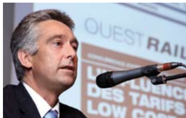
Toujours très présent dans les débats sur les transports, le Conseiller d'Etat François Marthaler participait également au colloque OUESTRAIL. Il préside actuellement la CTSS (Conférence des transports de Suisse occidentale).

Suisse occidentale. La mise au point du dossier bat son plein et le projet sera mis en consultation au printemps 2007. En fonction de l'état du projet à fin 2006, OUESTRAIL est d'avis que la mise à disposition des crédits doit être accélérée et ne pas attendre 2020 comme le prévoit le projet officiel. Par ailleurs, le montant prévu initialement pour RAIL 2000, qui constitue déjà un minimum, doit être octroyé pour les infrastructures ZEB, à savoir entre 7 et 8 mrd de francs et non 5 mrd seulement comme cela est prévu à fin 2006.